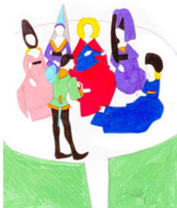
Giardino della Villa (Dec. III Intr. 11)

«Il veder questo giardino, il suo bello ordine, le piante e la fontana co' ruscelletti procedenti da quella tanto piacque a ciascuna donna e a' tre giovani, che tutti cominciarono a affermare che, se Paradiso si potesse in terra fare, non sapevano conoscere che altra forma che quella di quel giardino gli si potesse dare.»