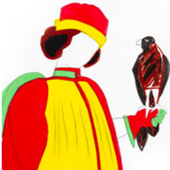
Federico degli Alberighi (Dec. V 9, 37)

«le ricchezze mancarono e esso rimase povero, senza altra cosa che un suo poderetto piccolo essergli rimasa, [...], e oltre a questo un suo falcone de' miglior del mondo.»