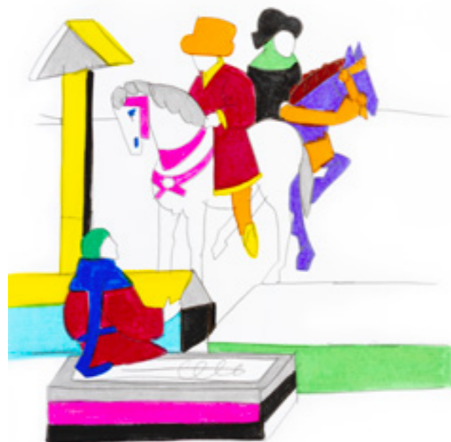
Guido Cavalcanti (Dec. VI 9, 12)

«Signori, voi mi potete dire a casa vostra ciò che vi piace.»