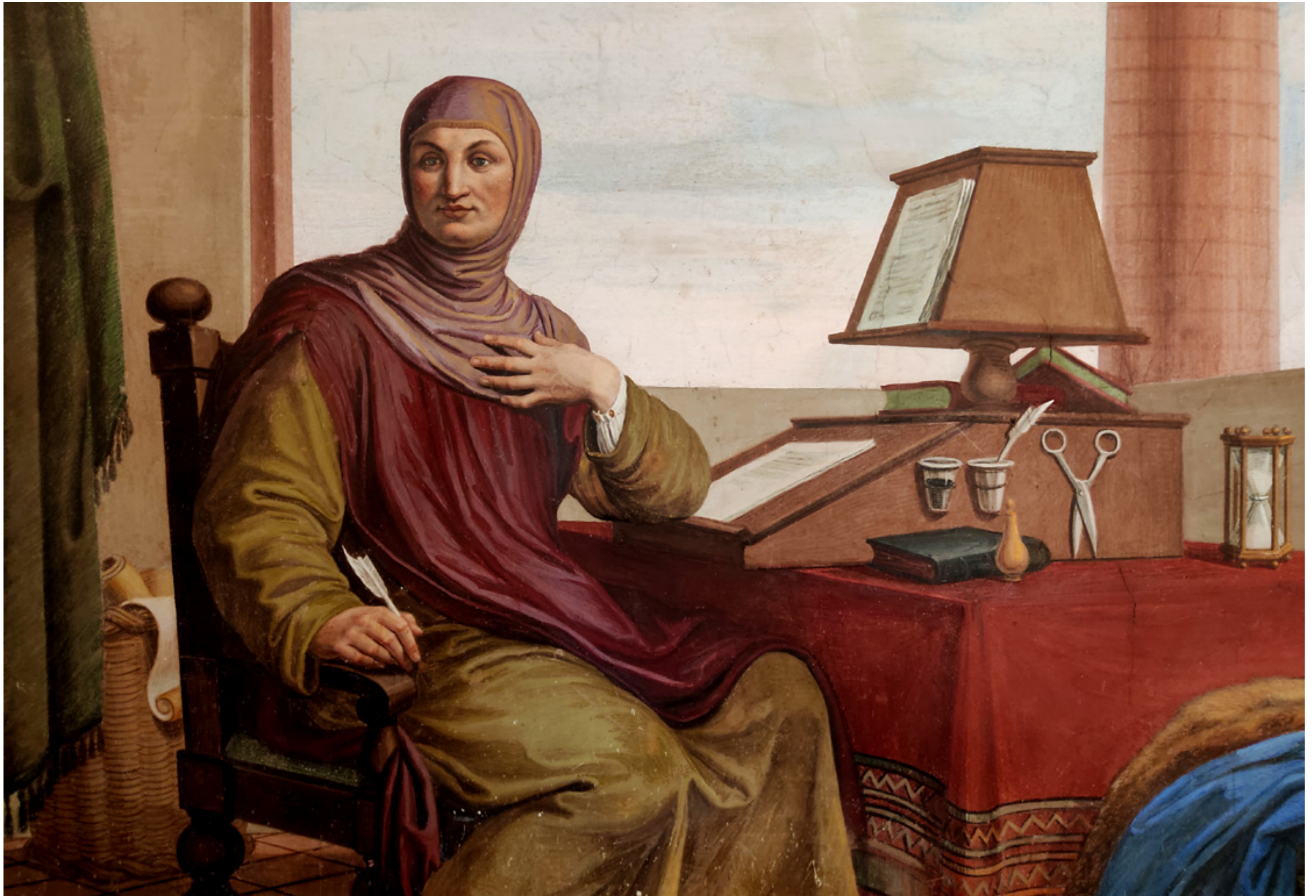
Pietro Benvenuti, Giovanni Boccaccio al suo tavolo da lavoro, affresco, Certaldo, Casa Boccaccio, 1826