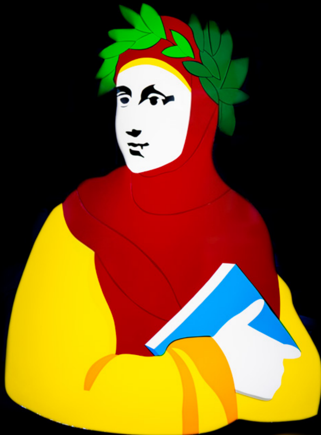
Image of the bust that inspired the celebrations logo.

Immagine del mezzobusto che ha ispirato il logo delle celebrazioni.